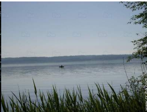
vista sobre el lago