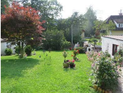
vista sobre el jardin/parque