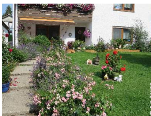
vista sobre el jardín/parque