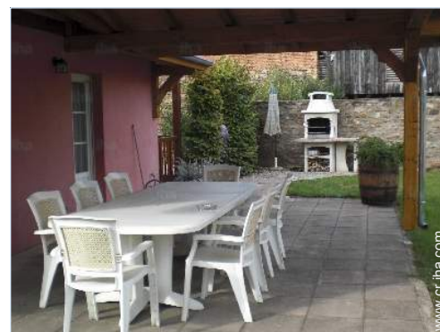
mesa(s) de jardin