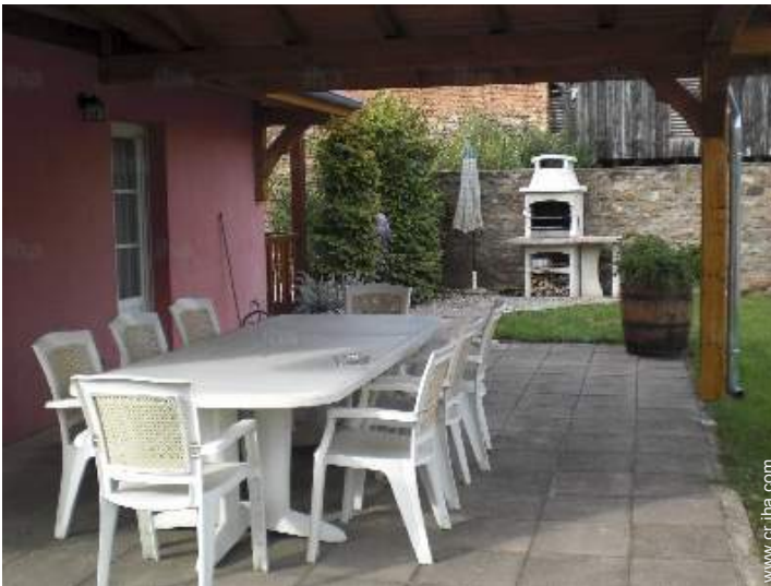
mesa(s) de jardin