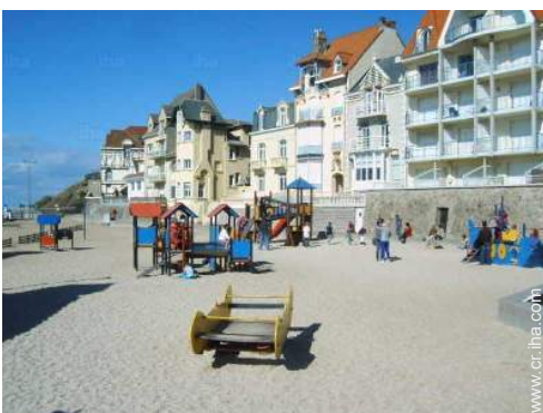
actividades de ocio cercanas