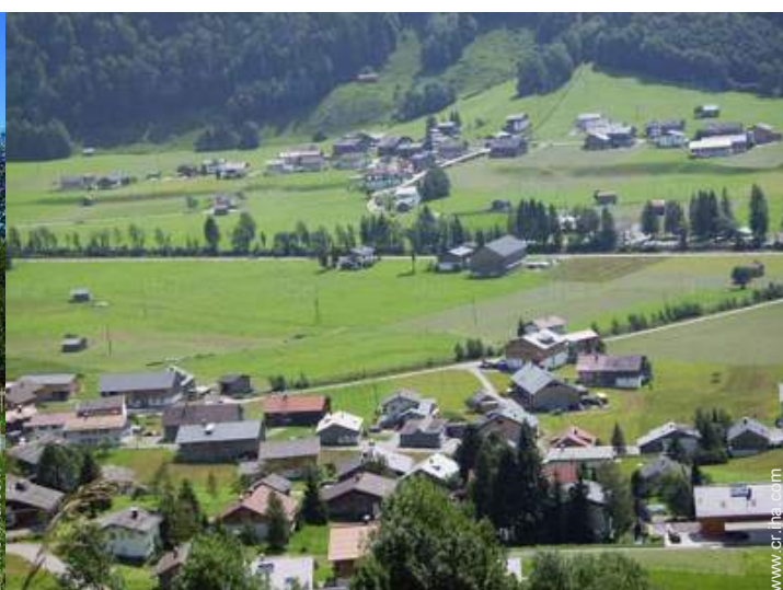
vista sobre el campo