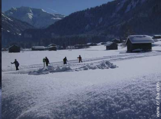
actividades de ocio invernales cercanas