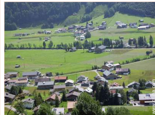
vista sobre el campo

Pistas de esquí 1km Remontes 1km Piscina climatizada 500m Playa nudista 50km Pista de tenis pública 800m Recorrido de golf 18 hoyos 30km Cascada 800m Río 300m Lago 50km Bosque 800m Cadena montañosa 1km