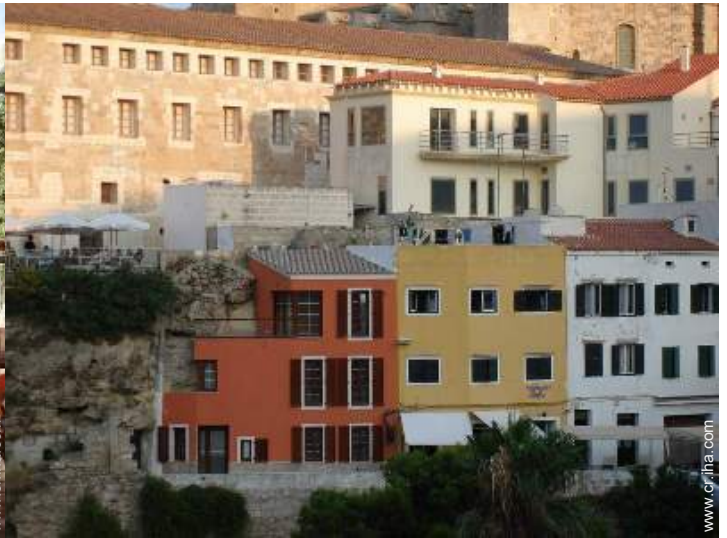
vista de conjunto