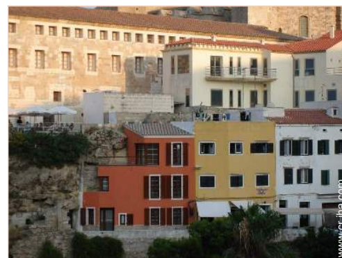
vista de conjunto