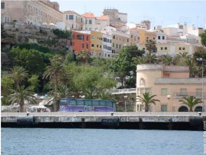
Casa con Encanto