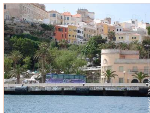
Casa con Encanto

El centro <50m Parada/estación de guagua 300m Alquiler de carro 200m Alquiler de barco 200m Panadería <50m Pequeños comercios <50m Supermercado <50m Peluquería 100m Correos 200m Banco <50m Cajero automático <50m Farmacia 50m Doctor 200m Hospital 300m