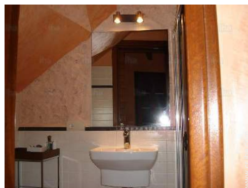
cuarto de baño