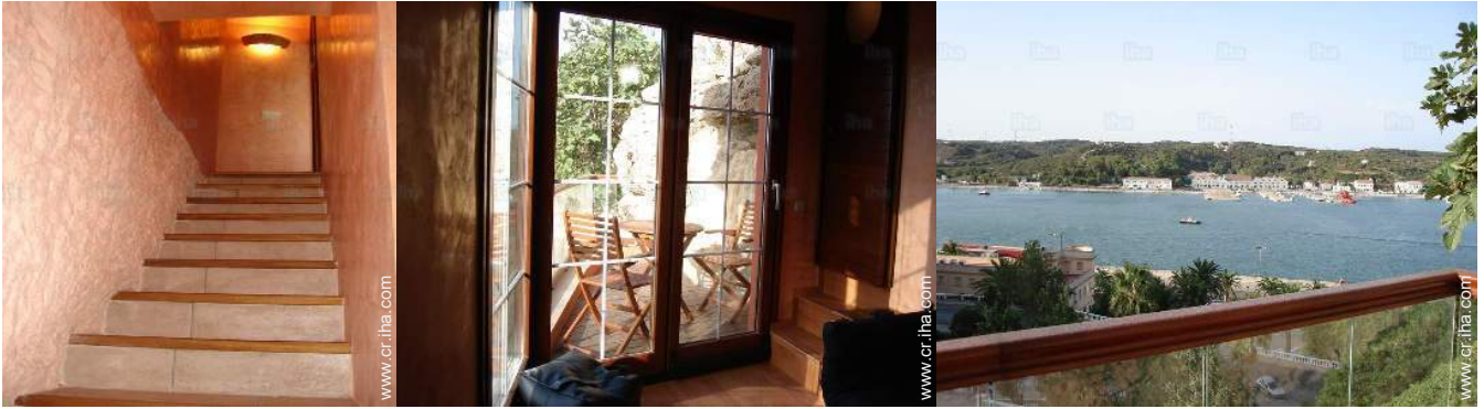
Propiedad con Encanto