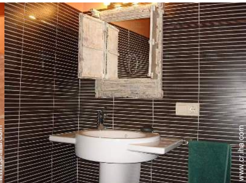
cuarto de baño