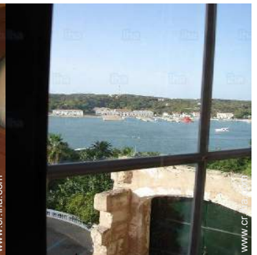
vista desde el dormitorio