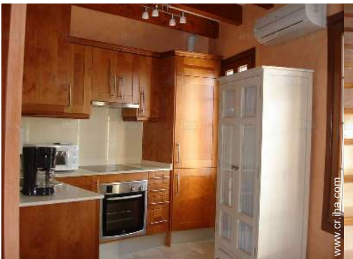
área de cocina