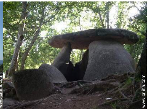
Zonas atractivas y relajación