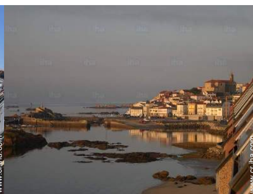
vista sobre el puerto