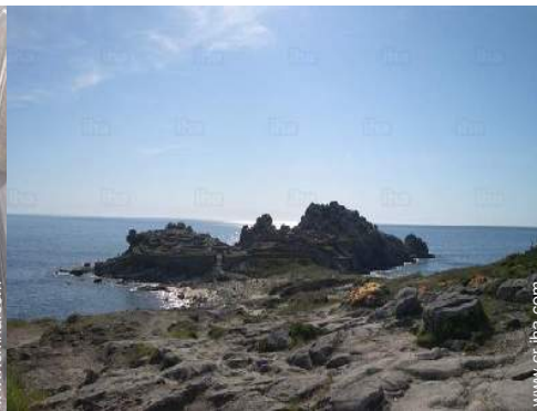
Zonas atractivas y relajación