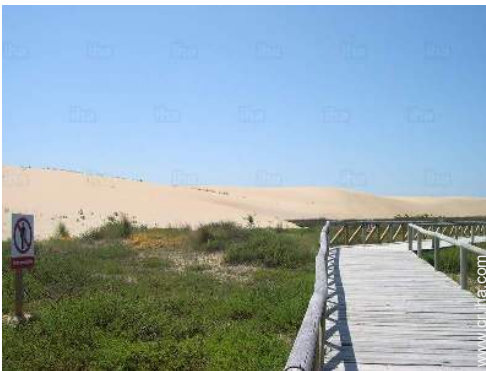
Zonas atractivas y relajación