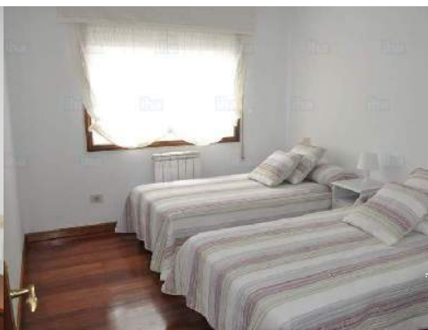
camas gemelas sencilla