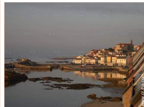
vista sobre el puerto

Peluquería <50m Banco 200m Cajero automático 200m Farmacia 50m Hospital 7,5km Dispensario 2km