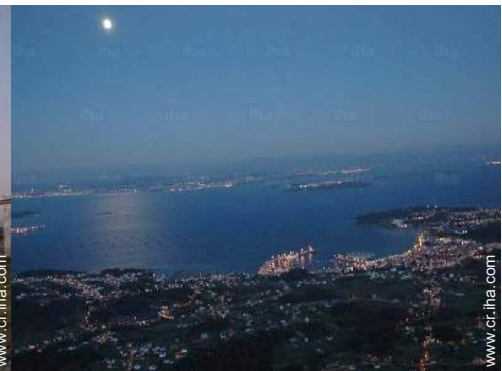
Zonas atractivas y relajación