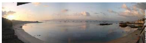
vista sobre la apuesta del sol