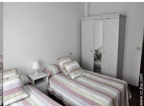
camas gemelas sencilla