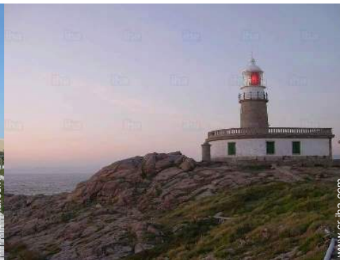
Zonas atractivas y relajación