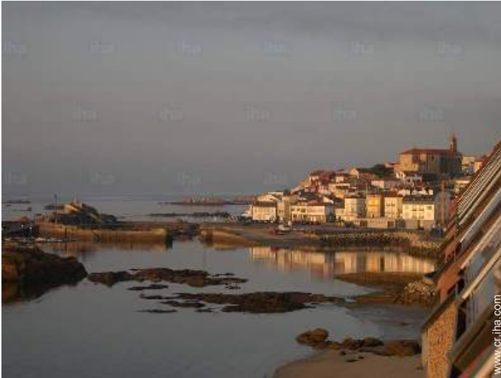
vista sobre el puerto