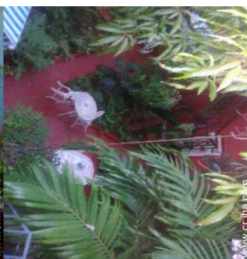
vista desde la azotea