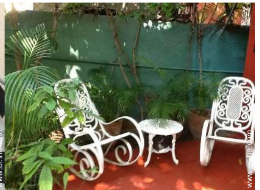
área de descanso