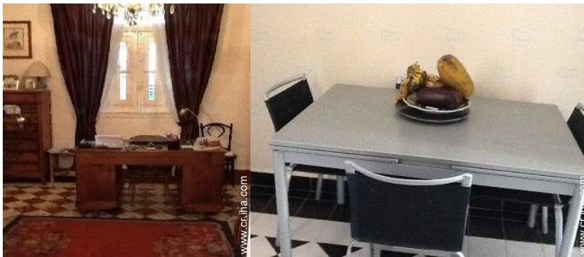
sala de biblioteca