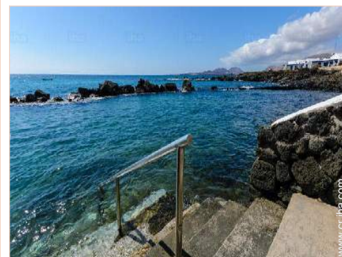
Piscina de agua de mar