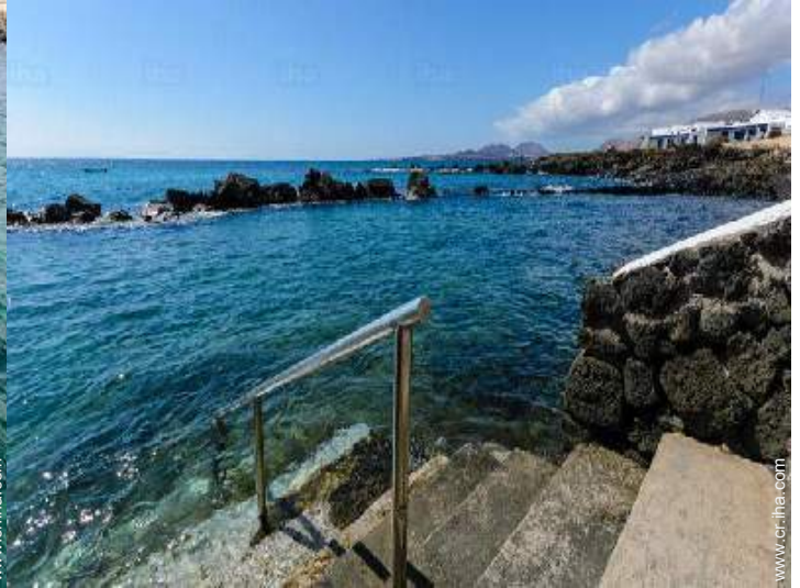
Piscina de agua de mar