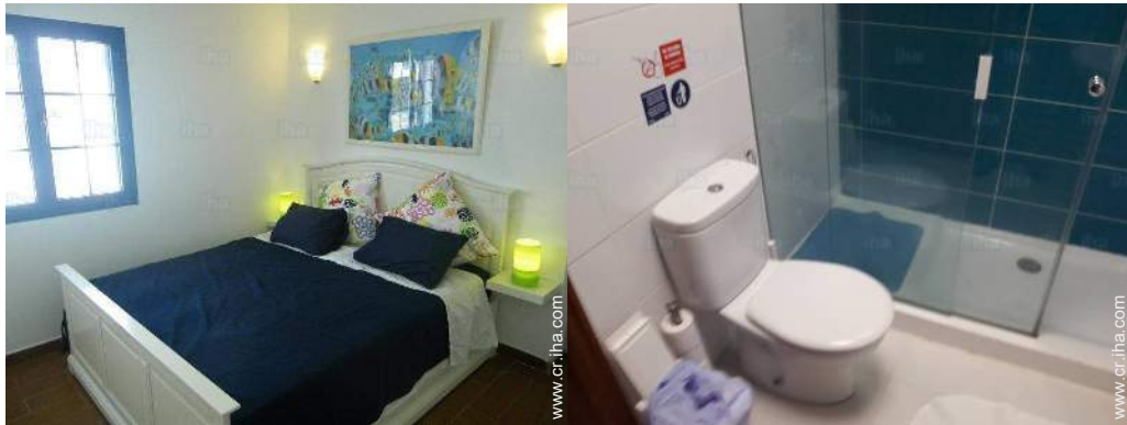
Bungalow con Encanto