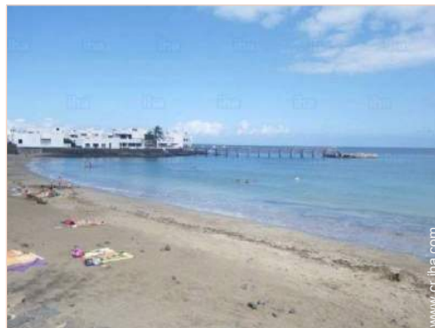
playa de arena