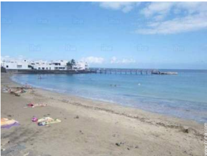
playa de arena