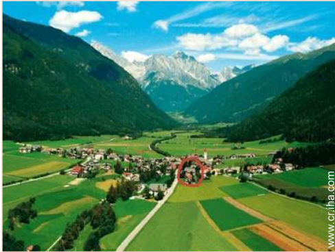
vista sobre el pueblo