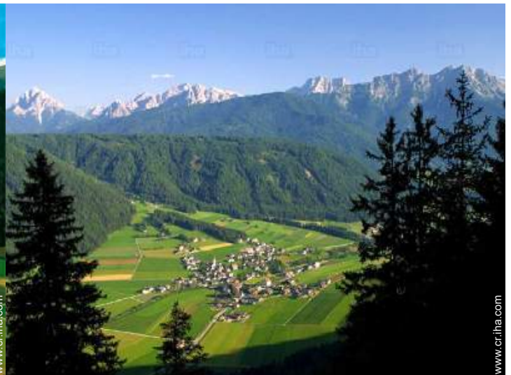
vista sobre el pueblo