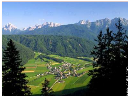
vista sobre el pueblo

Acondicionado para disminuidos : movilidad