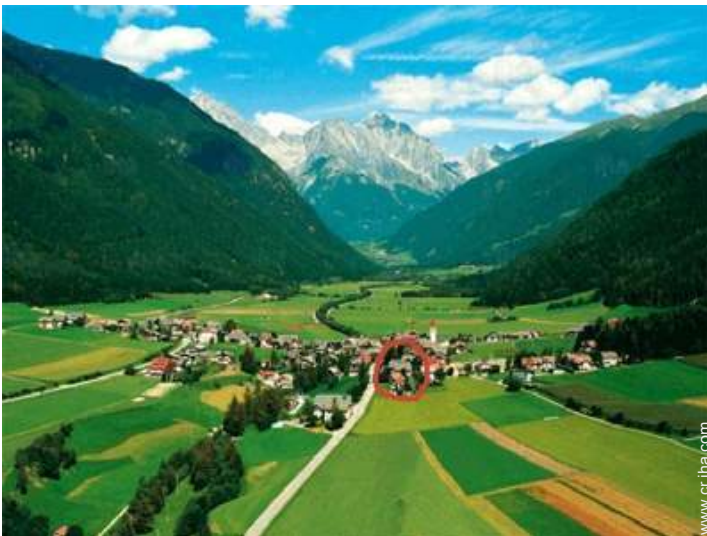
vista sobre el pueblo