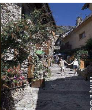
vista sobre la calle peatonal