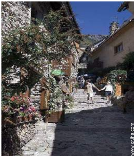
vista sobre la calle peatonal