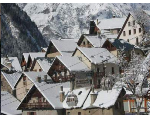
vista sobre el pueblo