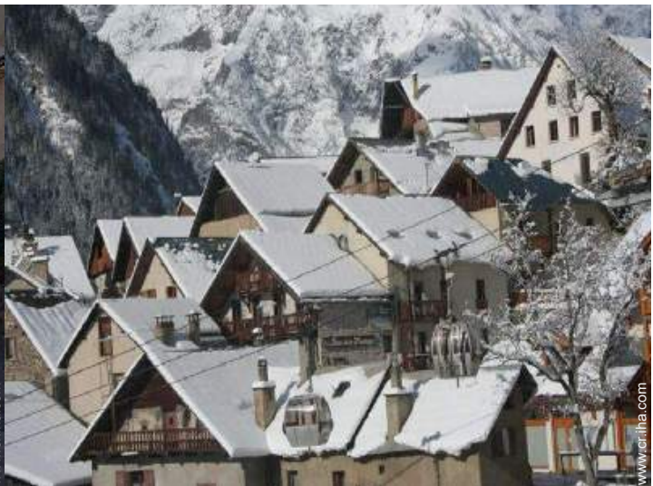
vista sobre el pueblo