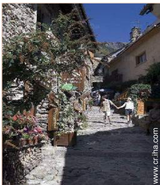
vista sobre la calle peatonal