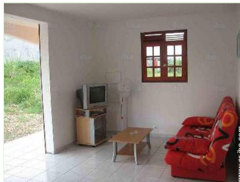
sofá cama 2 pers