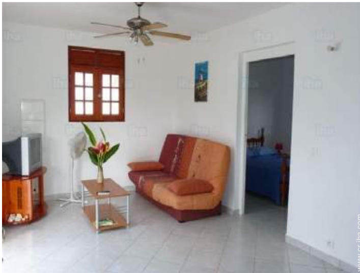
sofá cama 2 pers