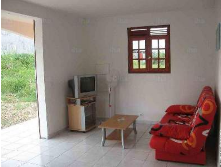
sofá cama 2 pers