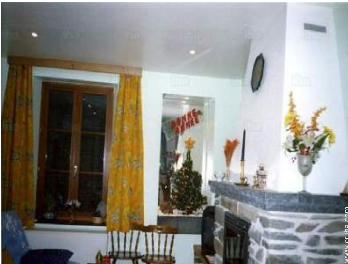
estufa de madera