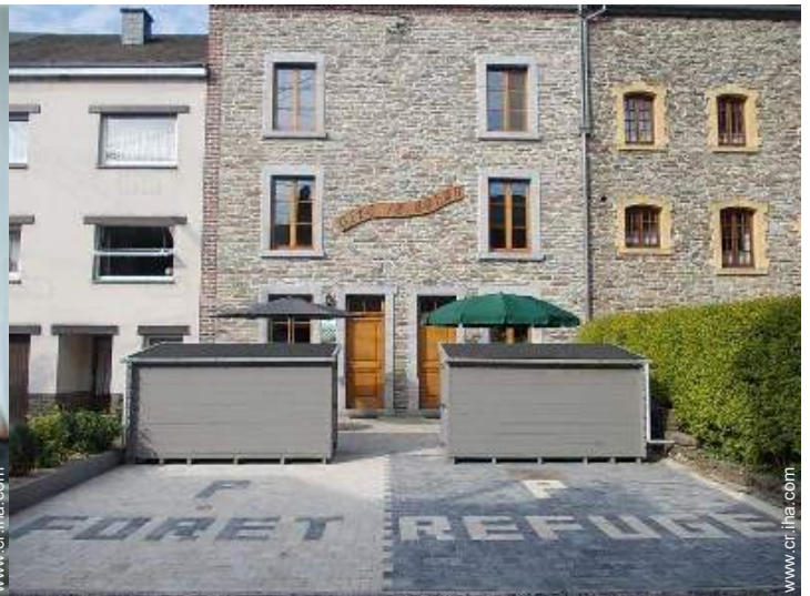
Marco exterior a disposición de los huéspedes