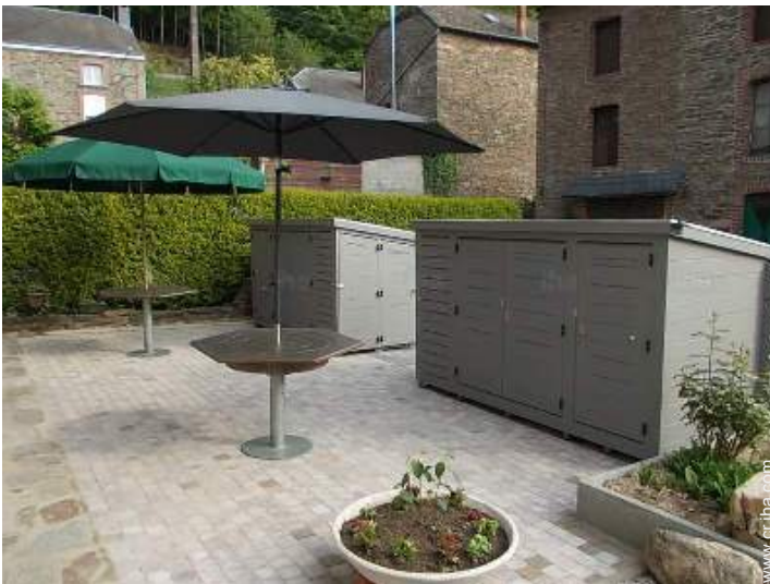
Instalaciones exteriores a disposición de los huéspedes