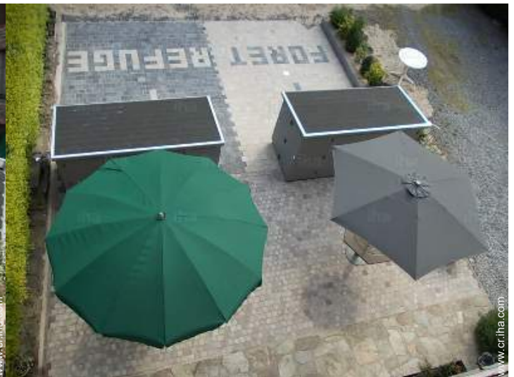
Instalación exterior a disposición de los huéspedes