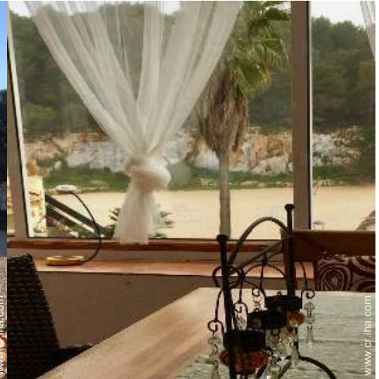
vista desde la veranda