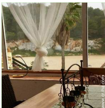
vista desde la veranda