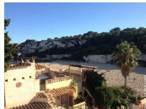
vista desde la azotea

Centro del pueblo 5km El centro 15km Parada/estación de guagua 300m Alquiler de bici/MTB 1,5km Alquiler de moto/escúter 1,5km Alquiler de carro 1,5km Alquiler de barco 5km Alquiler de equipo de buceo 5km Alquiler de Ropa blanca/lavandería 5km Panadería 300m Catering 5km Pequeños comercios 300m Supermercado 1,5km Comercios de lujo y de marcas 5km Peluquería 1,5km Cibercafé 200m Correos 5km Banco 5km Cajero automático 1,5km Farmacia 1,5km Doctor 500m Enfermera 1km Hospital 5km Dispensario 5km