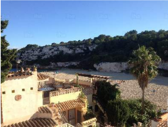
vista desde la azotea