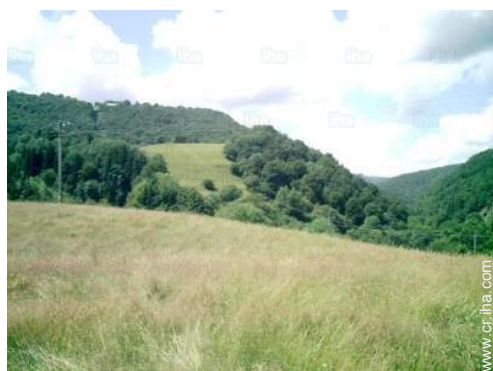
vista sobre campos agrícolas