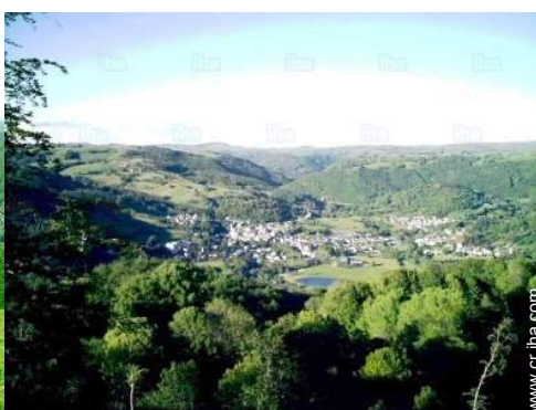
centro del pueblo