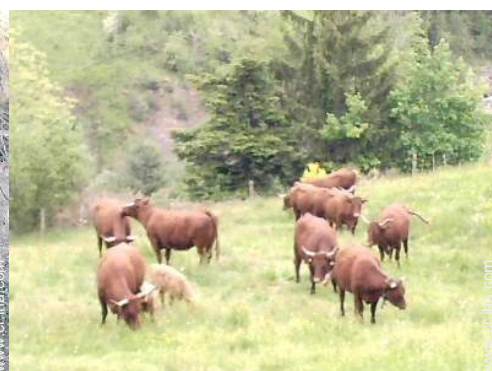
Presencia en el lugar