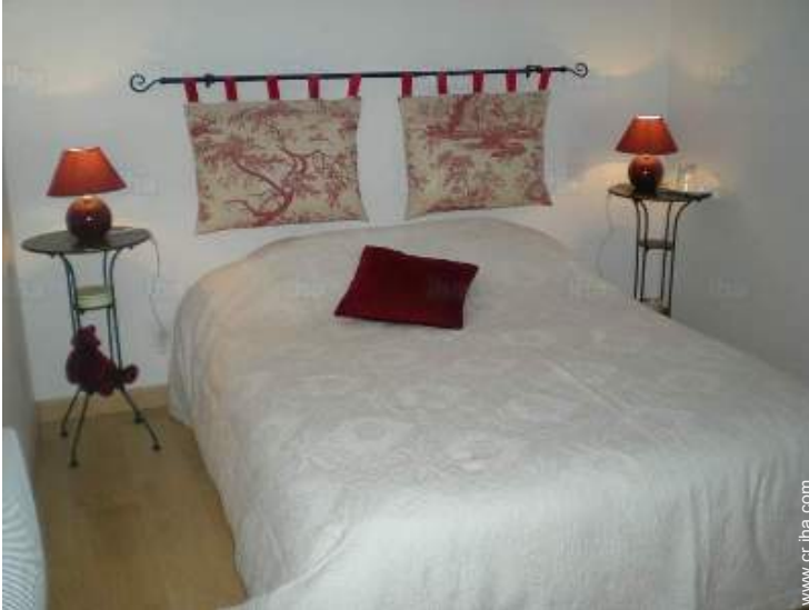
cama de matrimonio