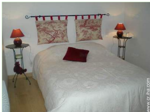
cama de matrimonio