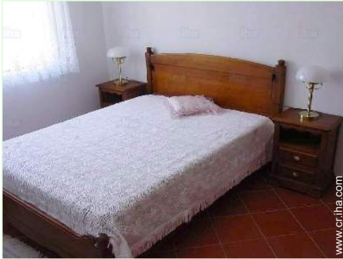
cama de matrimonio