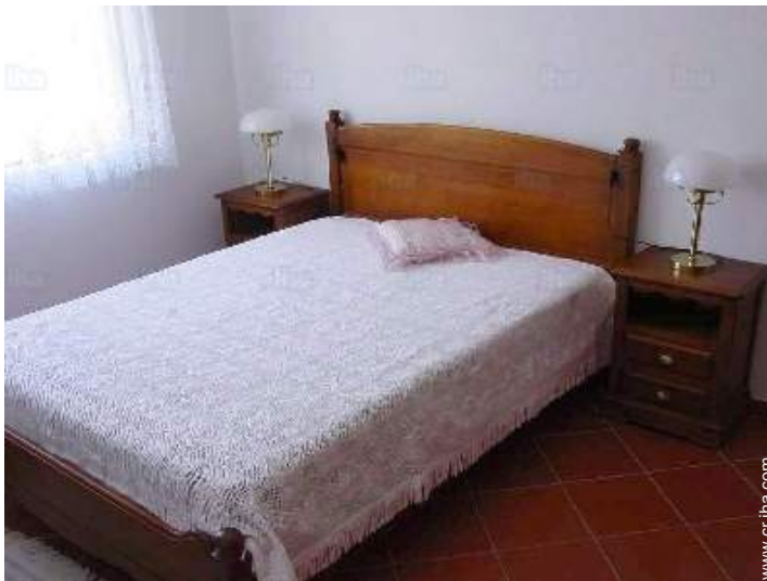
cama de matrimonio