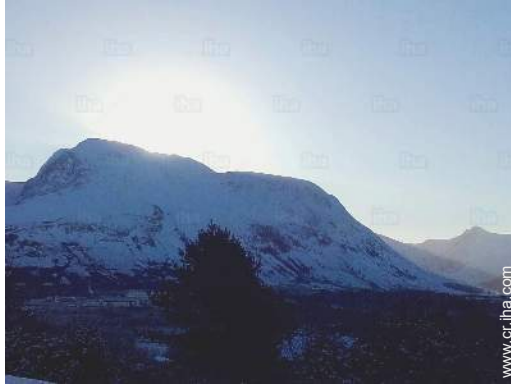
actividades de montaña cercanas