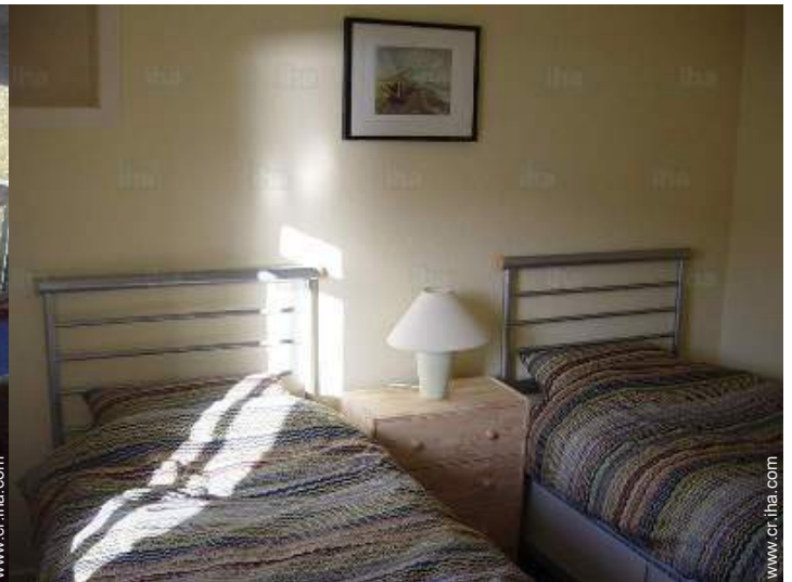
camas gemelas sencilla