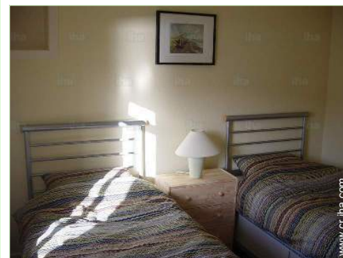
camas gemelas sencilla

Peluquería 300m Cibercafé 100m Correos 300m Banco 200m Cajero automático 200m Farmacia Doctor Hospital 800m Dispensario