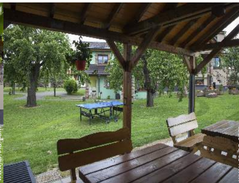
vista desde el jardín/parque