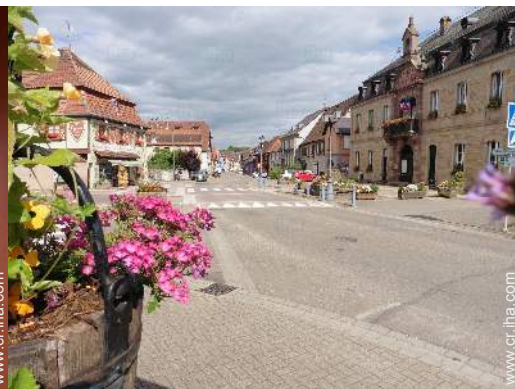
vista sobre el pueblo