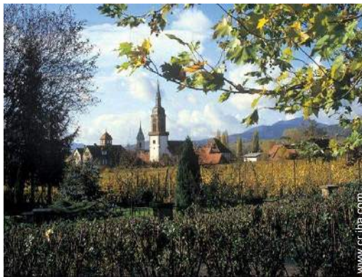
vista sobre el pueblo