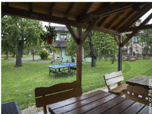
vista desde el jardín/parque