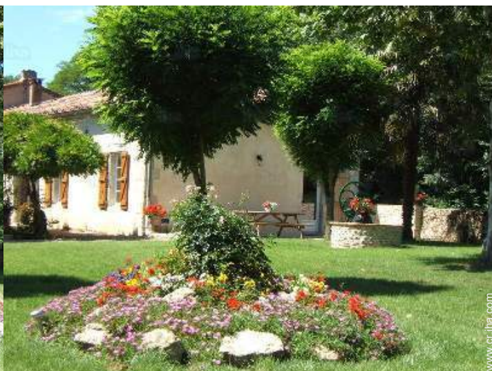
vista desde el jardin/parque