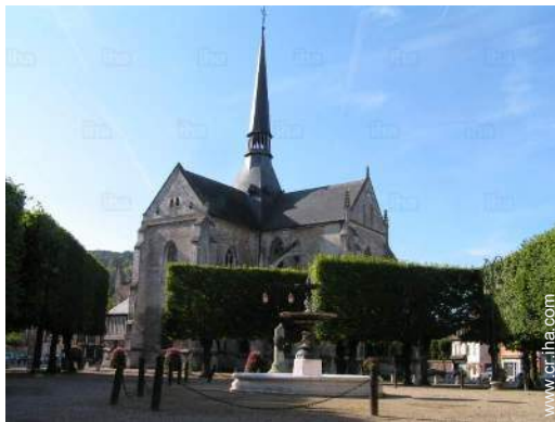
vista sobre el monumento