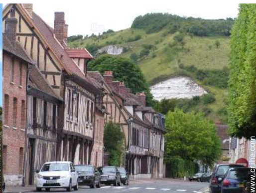
vista sobre el centro del pueblo