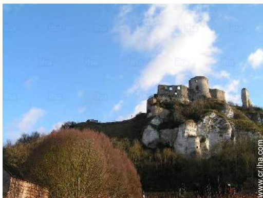
vista sobre el monumento