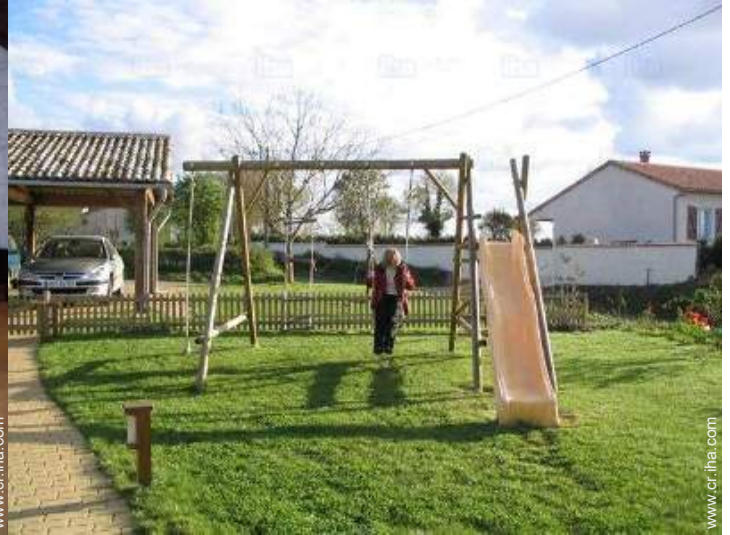
vista desde la cocina