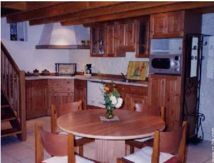
área de cocina