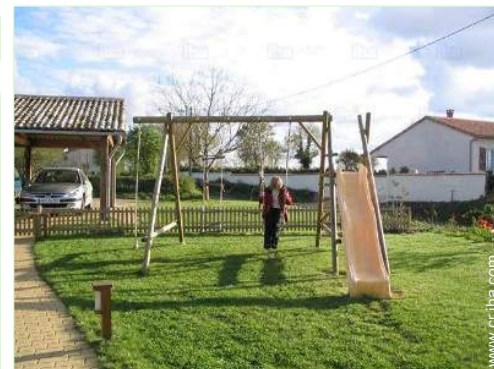
vista desde la cocina