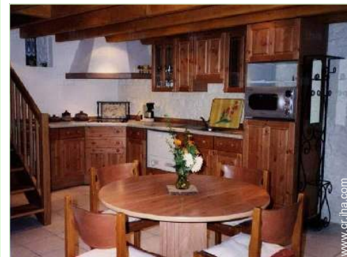
área de cocina