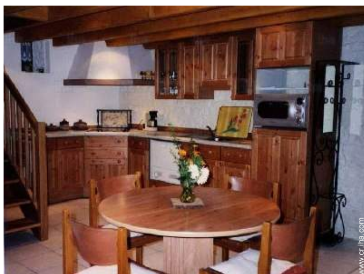
área de cocina