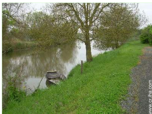
vista sobre el río