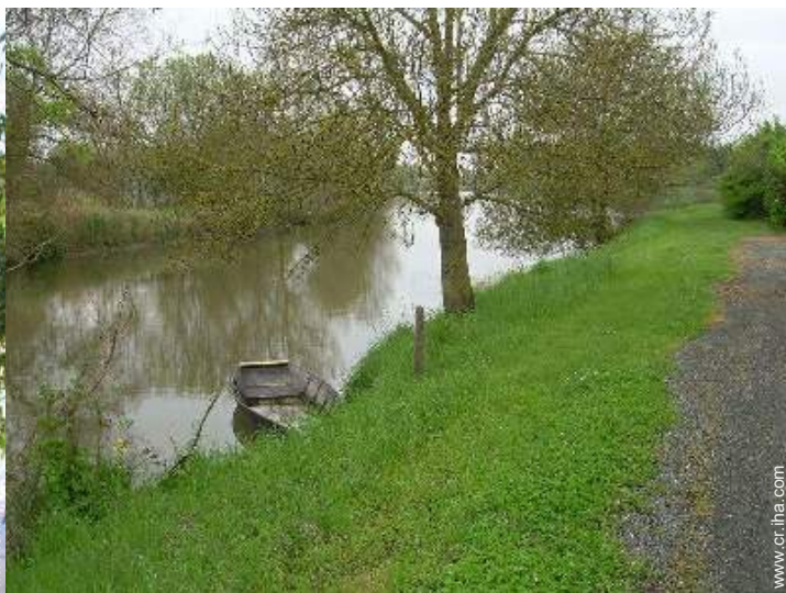
vista sobre el río