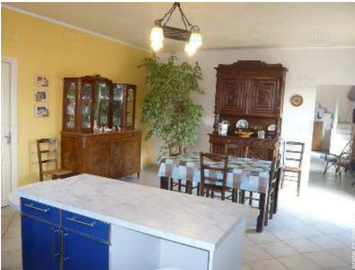
gran cocina independiente