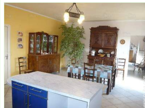
gran cocina independiente