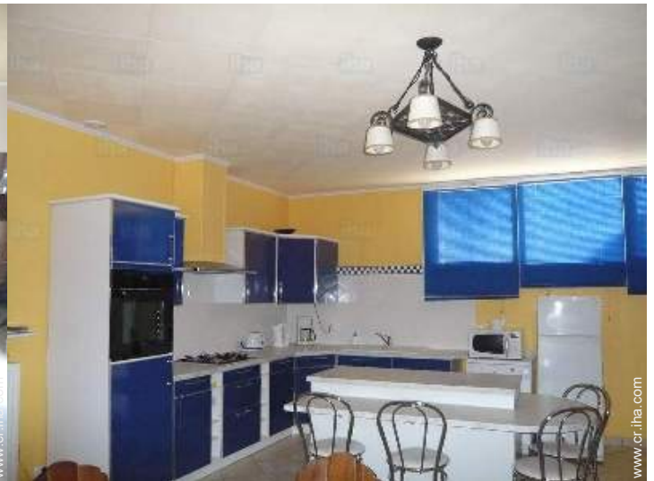
gran cocina independiente