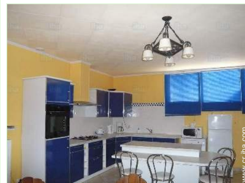
gran cocina independiente

Centro del pueblo <50m Panadería <50m Catering <50m Pequeños comercios <50m Supermercado 7,5km Comercios de lujo y de marcas 25km Peluquería <50m Correos <50m Banco <50m Cajero automático <50m Farmacia <50m Doctor <50m Enfermera <50m Hospital 15km