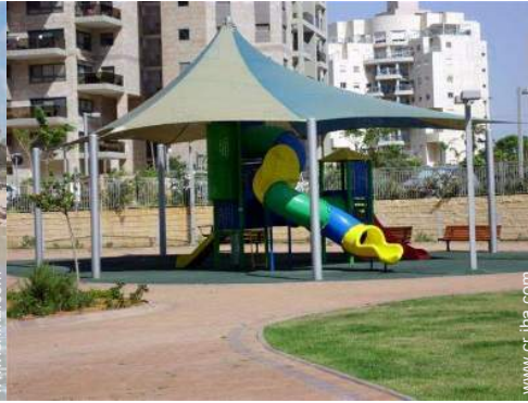
instalación de ocios