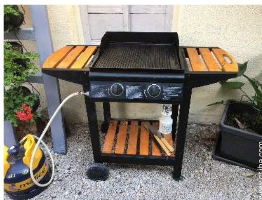
parrilla a gas