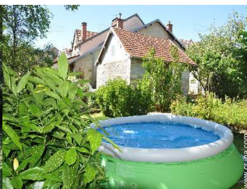
Instalaciones exteriores a disposición de los huéspedes