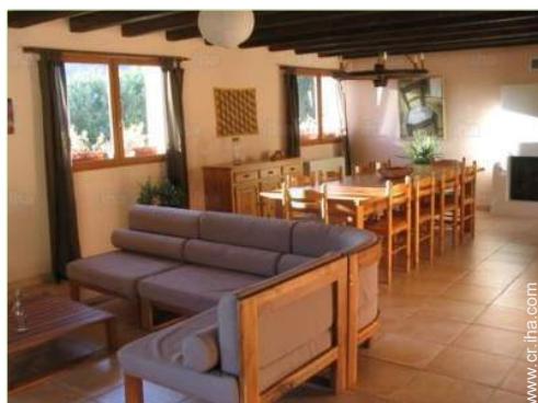
Disposición interior privado