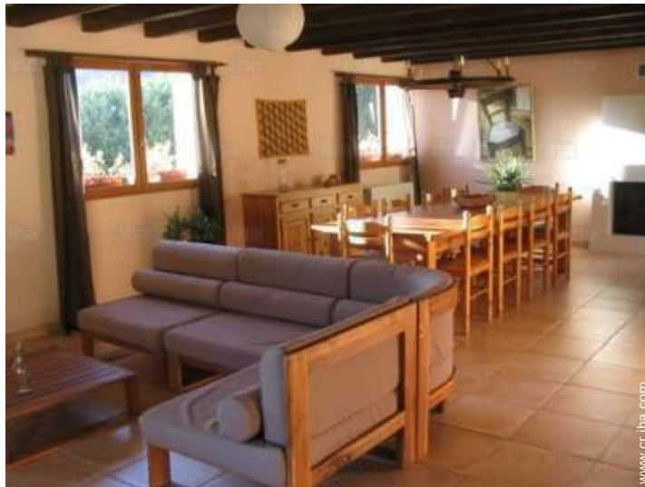
Disposición interior privado