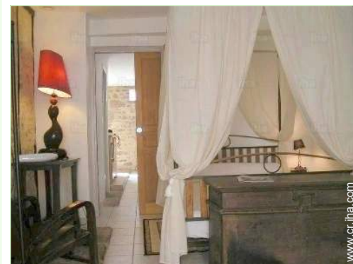
cama(s) de matrimonio(s) con baldaquín

Piscina climatizada <50m Pista de tenis pública 1km Recorrido de golf 18 hoyos 20km Base náutica 25km