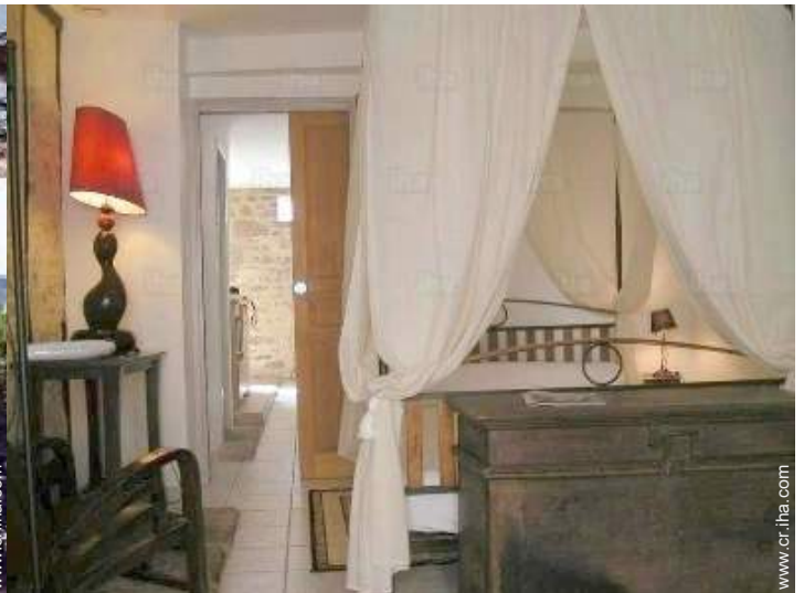
cama(s) de matrimonio(s) con baldaquín