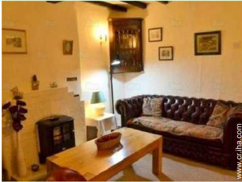
habitación de servicio