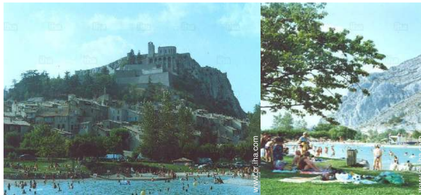
actividades de ocio cercanas