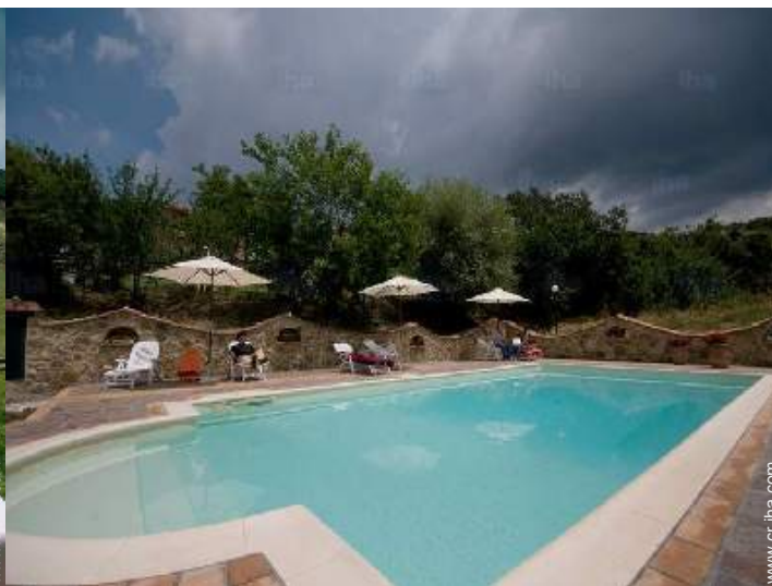
vista desde la piscina