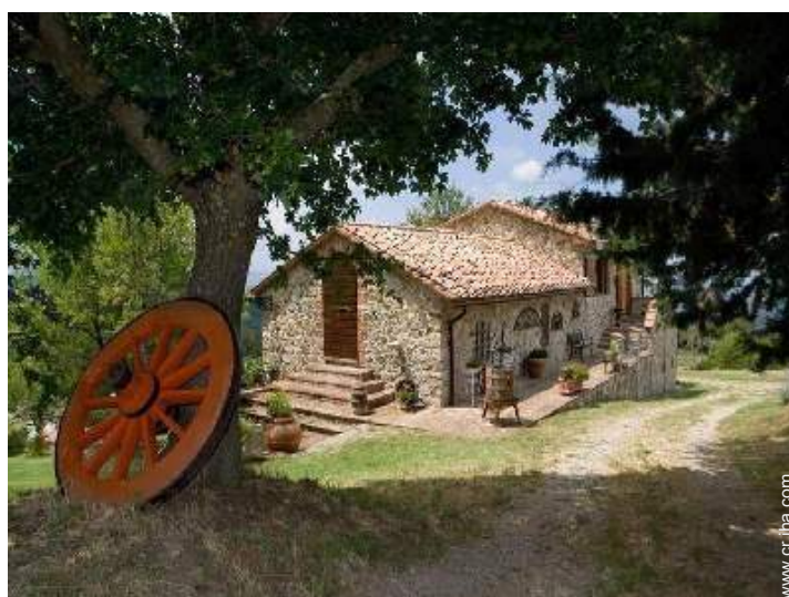
Casa de Piedra