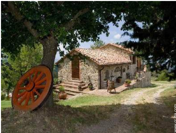
Casa de Piedra