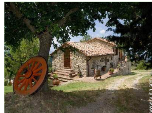
Casa de Piedra