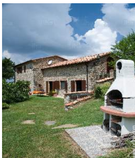
Marco exterior a disposición de los huéspedes