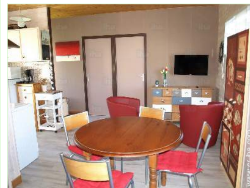
vista desde le comedor