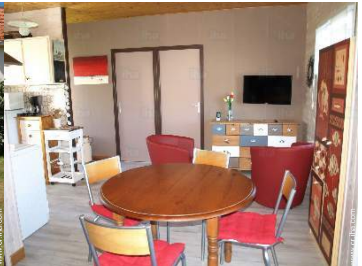
vista desde le comedor