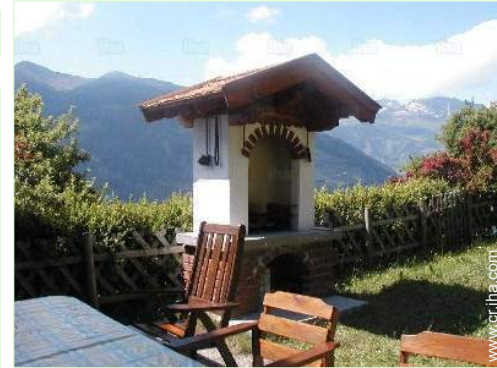
vista desde la terraza