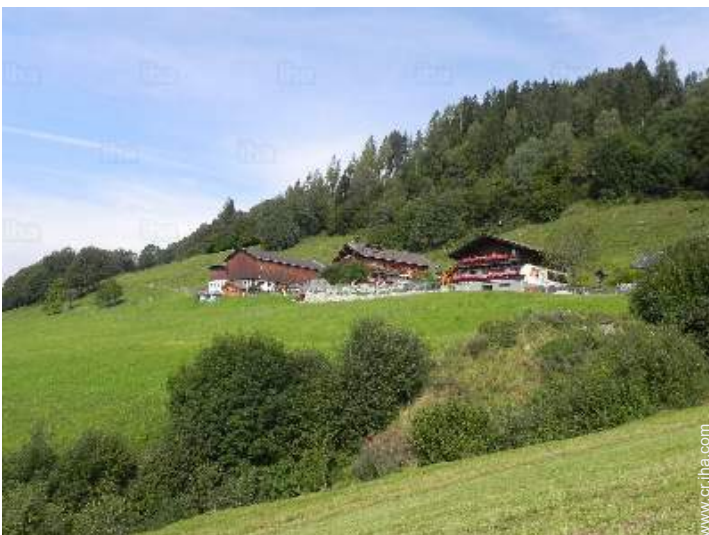
vista de conjunto