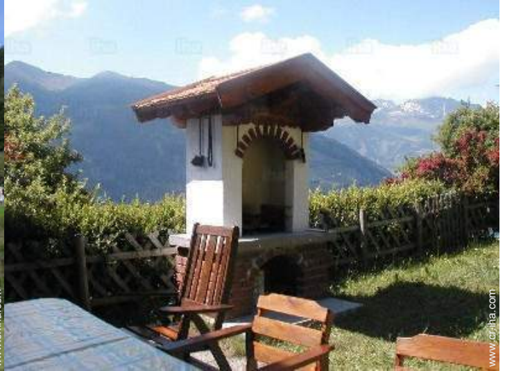
vista desde la terraza