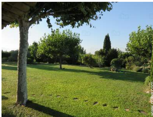
vista sobre el jardín/parque